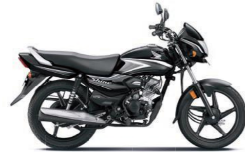
ग्रे के साथ ब्लैक

अभी ऑनलाइन बुक करें! www.honda2wheelerindia.com