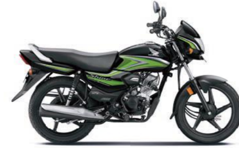
ग्रीन के साथ ब्लैक