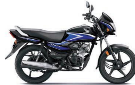
ब्लू के साथ ब्लैक