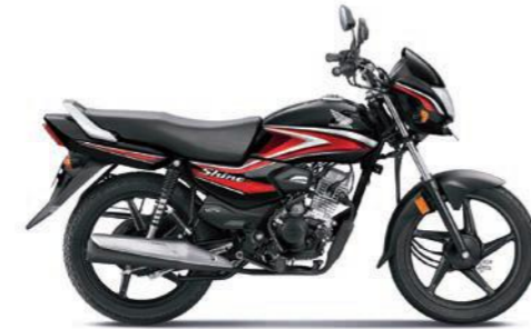
रेड के साथ ब्लैक