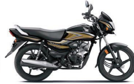
गोल्ड के साथ ब्लैक